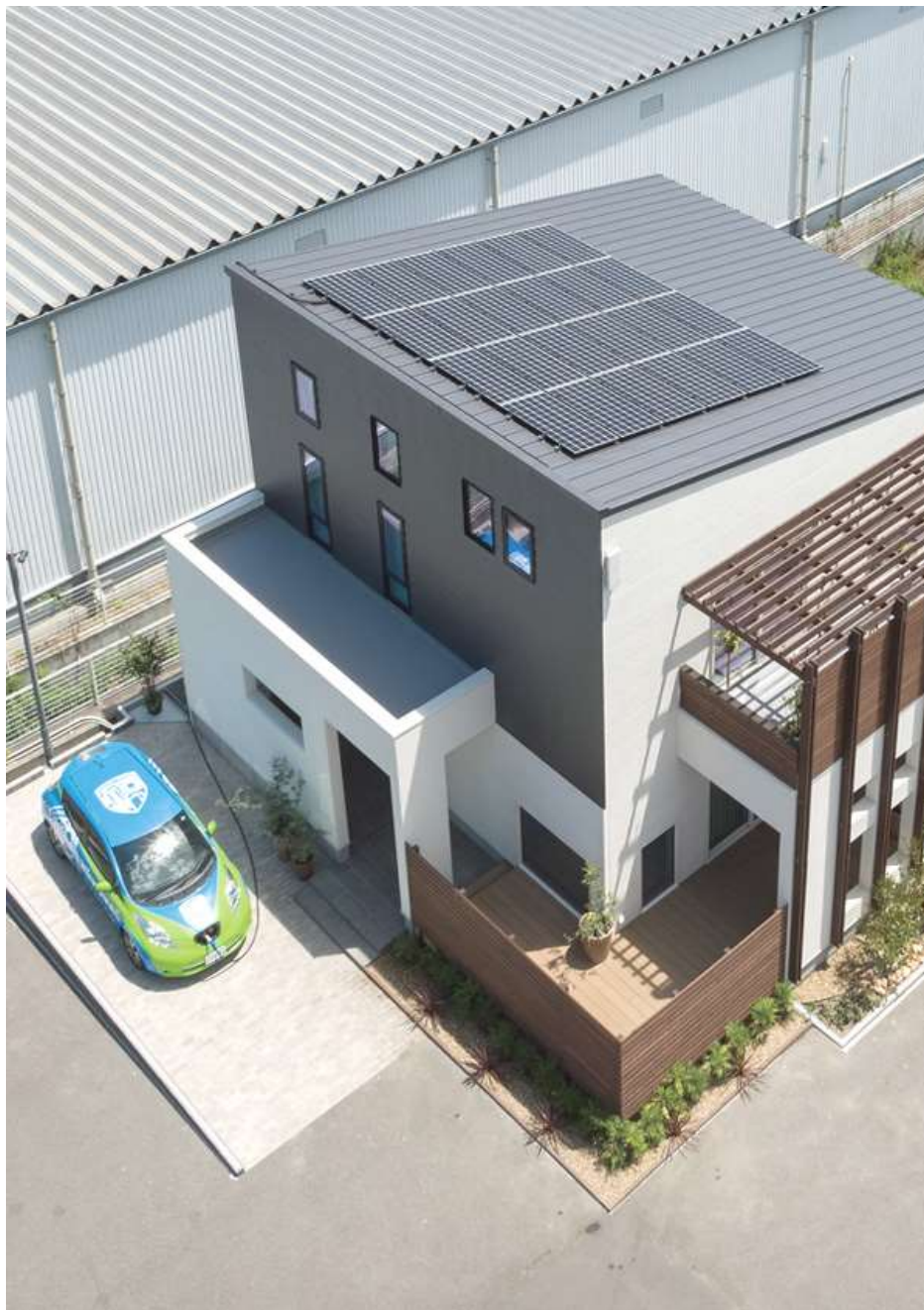
外観（太陽光パネル含む）