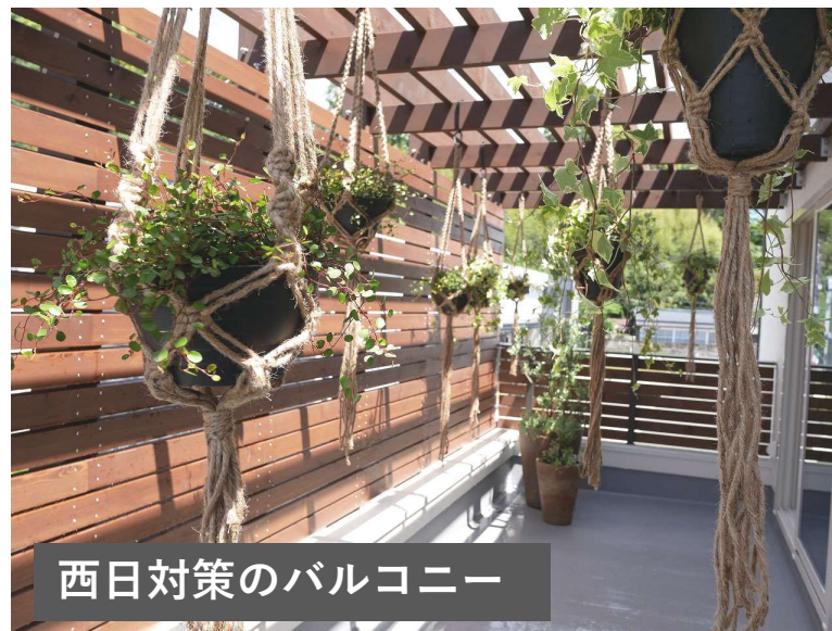
西日対策のバルコニー