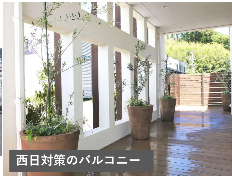
西日対策のバルコニー